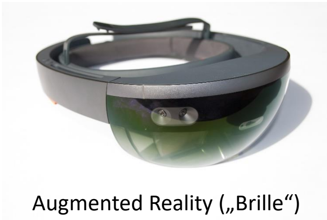
Augmented Reality („Brille“)