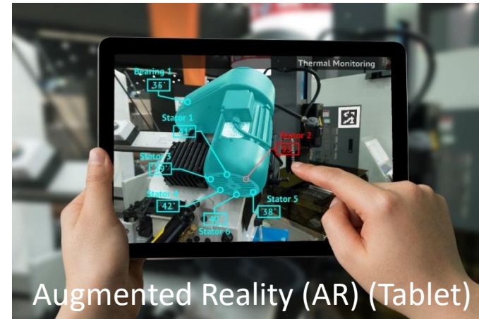
Augmented Reality (AR) (Tablet)