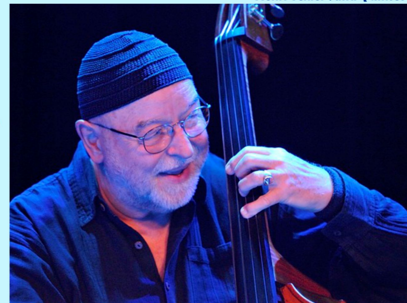
Henri Texier Sand Quintet

Bar à l'entracte au profit de la caisse des écoles.