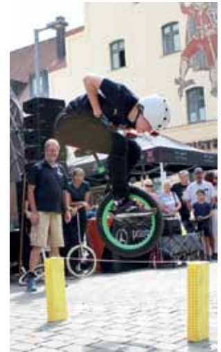
Aktiv mit dem Einrad beim Ingolstädter Bürgerfest

Weitere Informationen über Aktionen, Trainingszeiten sowie die Kontaktadresse findet man auf der Homepage der Einradler unter: