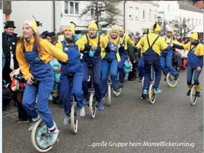
...große Gruppe beim Mantelflickerumzug

Im Februar waren wir an zwei Faschingsumzügen dabei. In Kösching nahmen wir mit einer riesigen Gruppe am Mantelflickerumzug teil, eine Woche später ging es nach Münchsmünster. Bei beiden Umzügen sind wir seit Jahren gern gesehener Gast, zeigen unser Können mit Tricks sowie Formationen und haben immer viel Spaß.