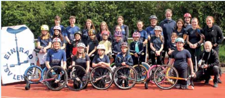
Lentinger Einradler mit dem Filmteam des Ingolstädter Fernsehens

An der Ramadama-Aktion der Gemeinde „Aktion saubere Landschaft“ nahmen auch dieses Jahr wieder Mitglieder der Einradgruppe teil, um das Gemeindegebiet von Müll und Unrat zu befreien.