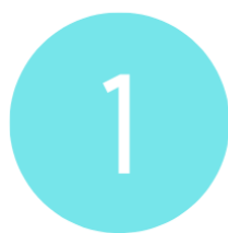
Figura 2: Objektivat e IPA III në fushën e qeverisjes së mirë