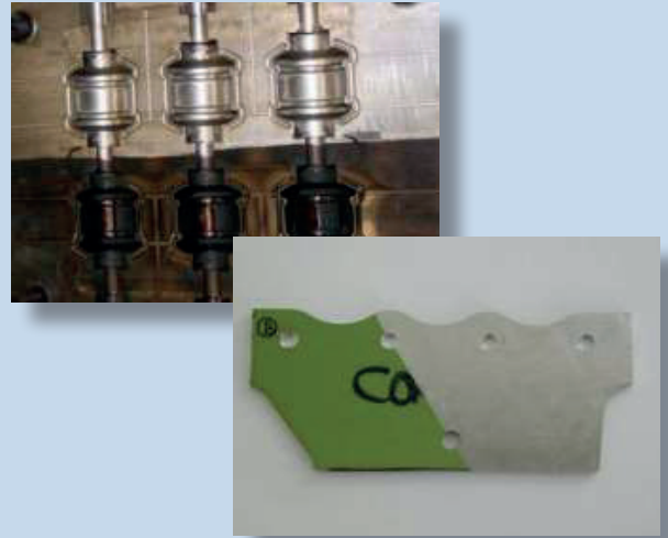
Nettoyage huile et peinture