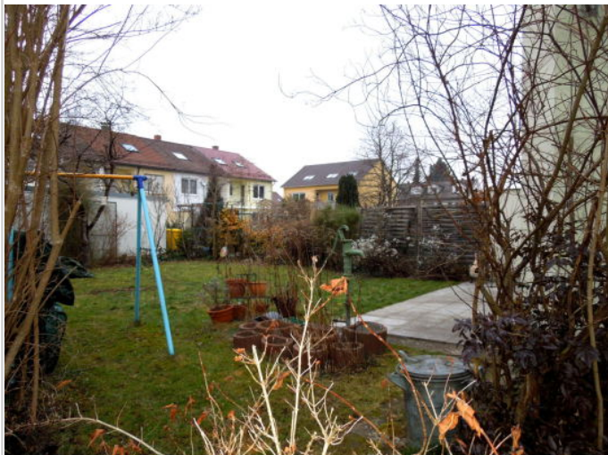
vielseitig zu nutzender Garten

Zimmer: 5,00 Wohnfläche ca.: 130,00 m 2 Kaufpreis: 370.000,00 EUR