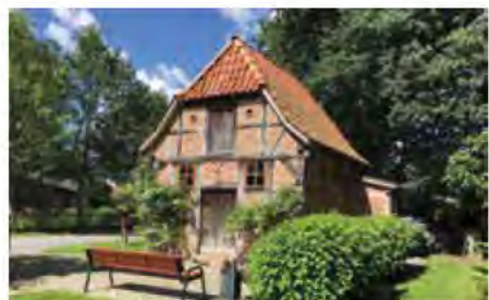
(Das Backhaus in Rethorn)

Palmsonntag, 24. März, 9.30 Uhr „Brot des Lebens“ – wir feiern Gottesdienst am Backhaus in Rethorn, wo anschließend Brot gebacken wird, das erworben und verzehrt werden kann. Musikalisch wird der Gottesdienst von Fred Molde mitgestaltet.