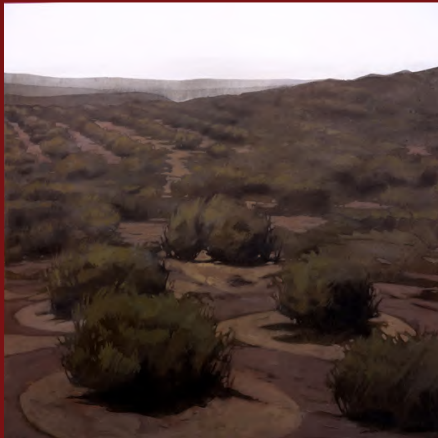
Origen. Retrato de un entorno.

Históricamente el paisaje es el género de la pintura que más se asocia a la idea de recreación e interpretación de un espacio plástico donde lo racional se apodera de lo orgánico, limitándolo, enmarcándolo, delimitando aquello que es infinito y no tiene bordes: la naturaleza. Ese afán de recordar e inmortalizar nuestro entorno, donde hemos habitado, en ocasiones traslada recuerdos de espacios que llevamos tatuados en nuestra retina, que se repiten y superponen al cerrar los ojos, trasladando ese exterior a nuestro interior.