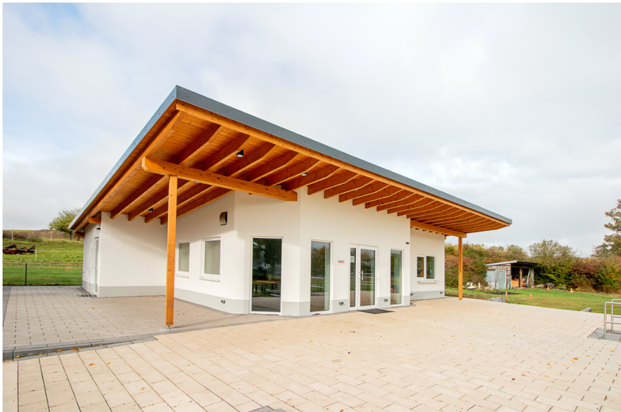
Außenansicht mit Terrasse

Alle Informationen rund um die Vermietung gibt es unter www.sf-burkhardsfelden.de oder per E-Mail an info@sf-burkhardsfelden.de .