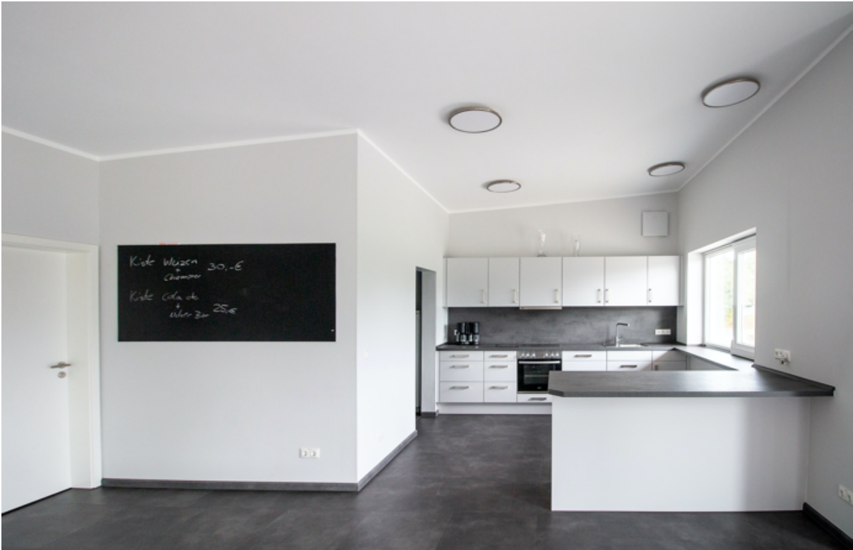
Multifunktionaler Innenraum mit Küche