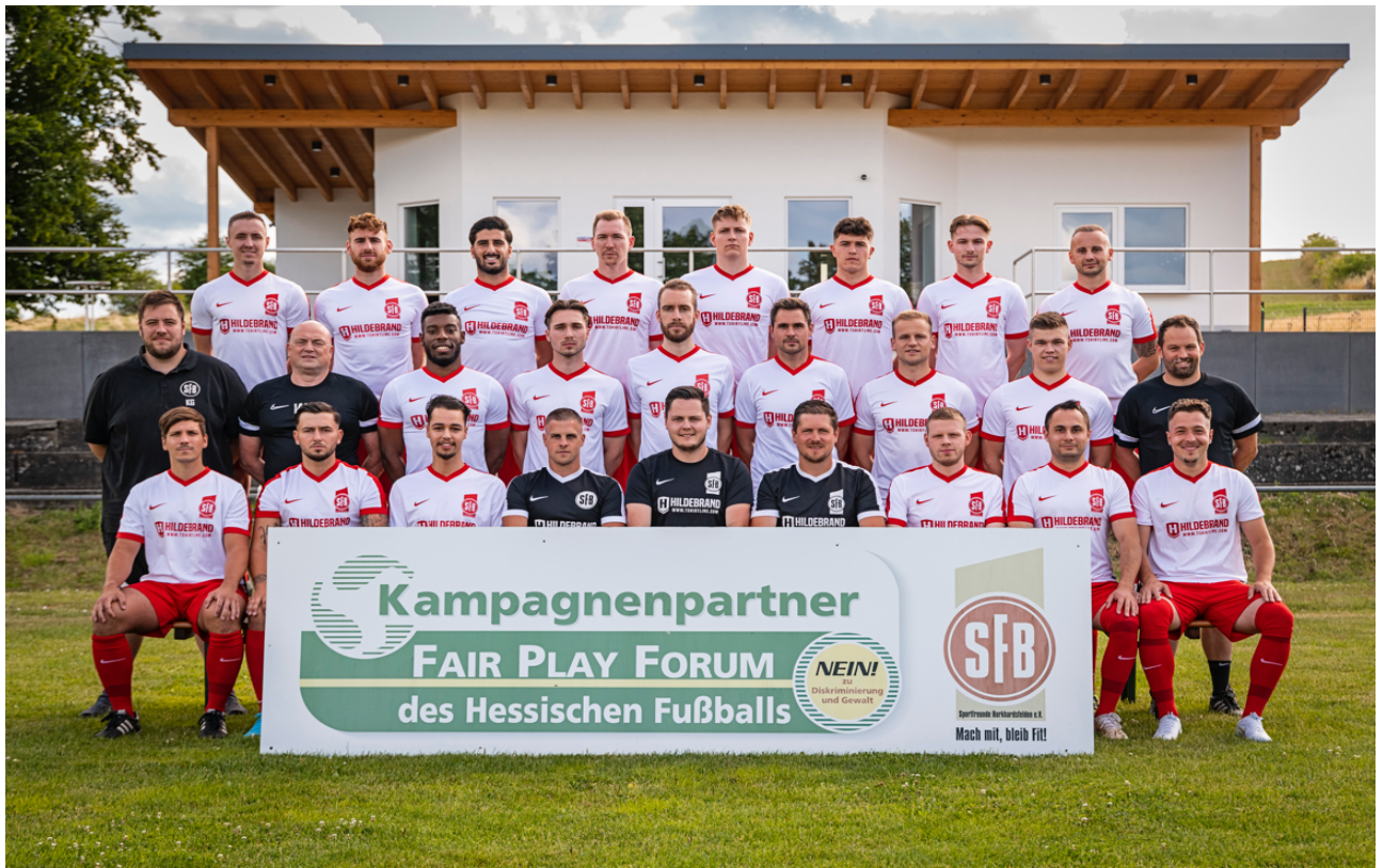
1. & 2. Mannschaft Saison 2022/2023