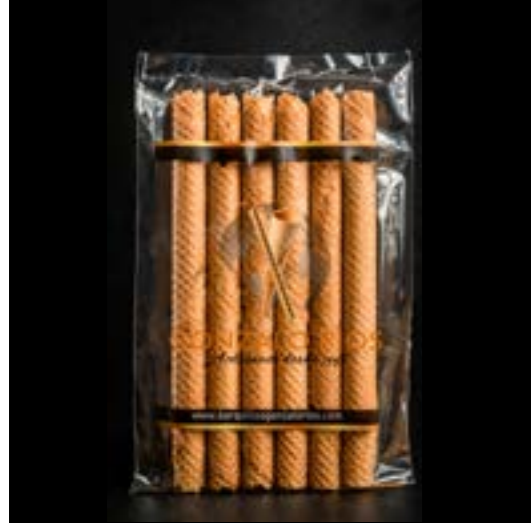
CANELA ARTESANA REF. 75