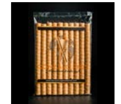
ROLLITO LARGO REF. 91

Envase: Paquetes de 10 unidades. Paquetes por caja: 35. CAJAS POR PALÉ: 60 CADUCIDAD: 18 meses.