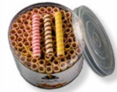
ROLLITO CORTO COLOR BOTE 460G REF. 201