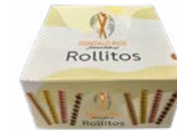
ROLLITO LARGO CAJA 750G REF. 19

Mezclado de ingredientes, distribución a máquinas de cocción, moldeado, enfriado, empaquetado y paletización.