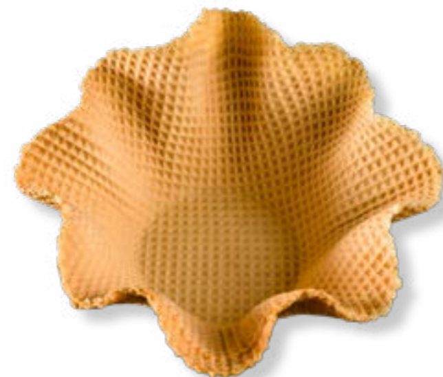
TULIPA GRANDE REF. 77