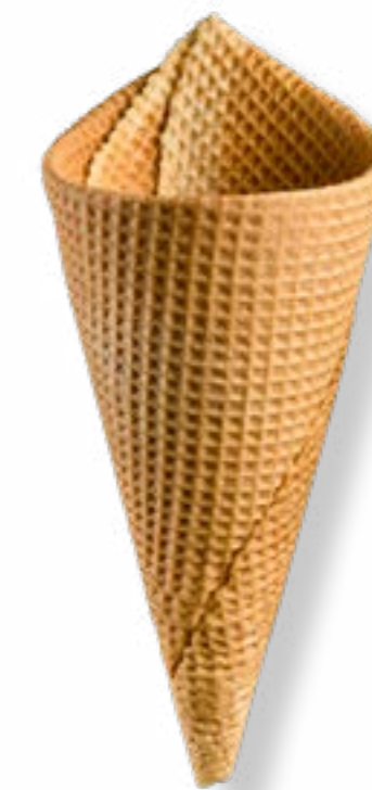
BARQUILLO ARTESANO AMERICANO Nº70 REF. 270

REF. 270: Envase: Bandeja/caja. Altura: 175 mm. Diámetro: 70 mm. Unidades por caja: 235. CAJAS POR PALÉ: 32 CADUCIDAD: 18 meses.