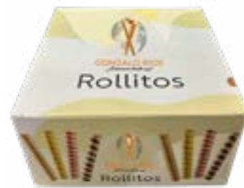
ROLLITO CORTO 750G REF. 20 ROLLITO CORTO COLOR 750G REF. 200