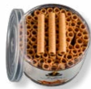
ROLLITO CORTO BOTE 320G REF. 69