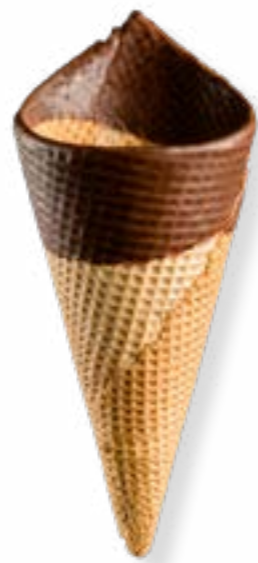
BARQUILLO ARTESANO AMERICANO Nº70 CORONA DE CHOCOLATE NEGRO REF. 70