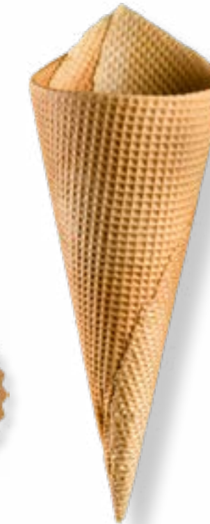
BARQUILLO ARTESANO AMERICANO Nº90 REF. 290

REF. 270: Envase: Bandeja/caja. Altura: 175 mm. Diámetro: 70 mm. Unidades por caja: 235. CAJAS POR PALÉ: 32 CADUCIDAD: 18 meses.