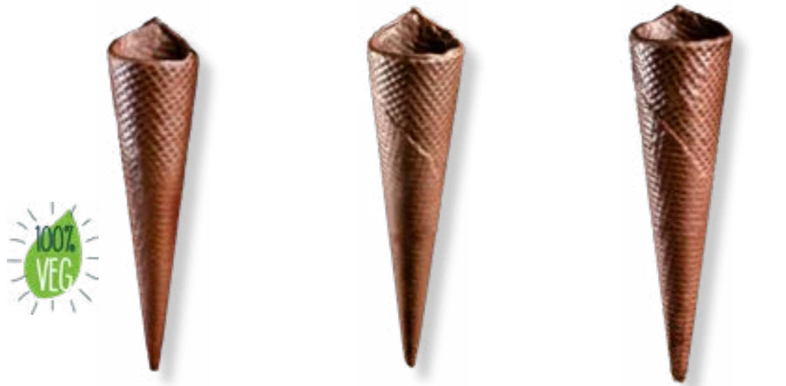
BARQUILLO Nº 40 CHOCOLATE NEGRO REF. 208