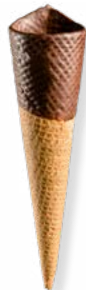
BARQUILLO Nº 45 CORONA DE CHOCOLATE REF. 5