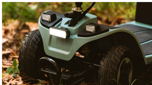
Eclairage LED haute visibilité