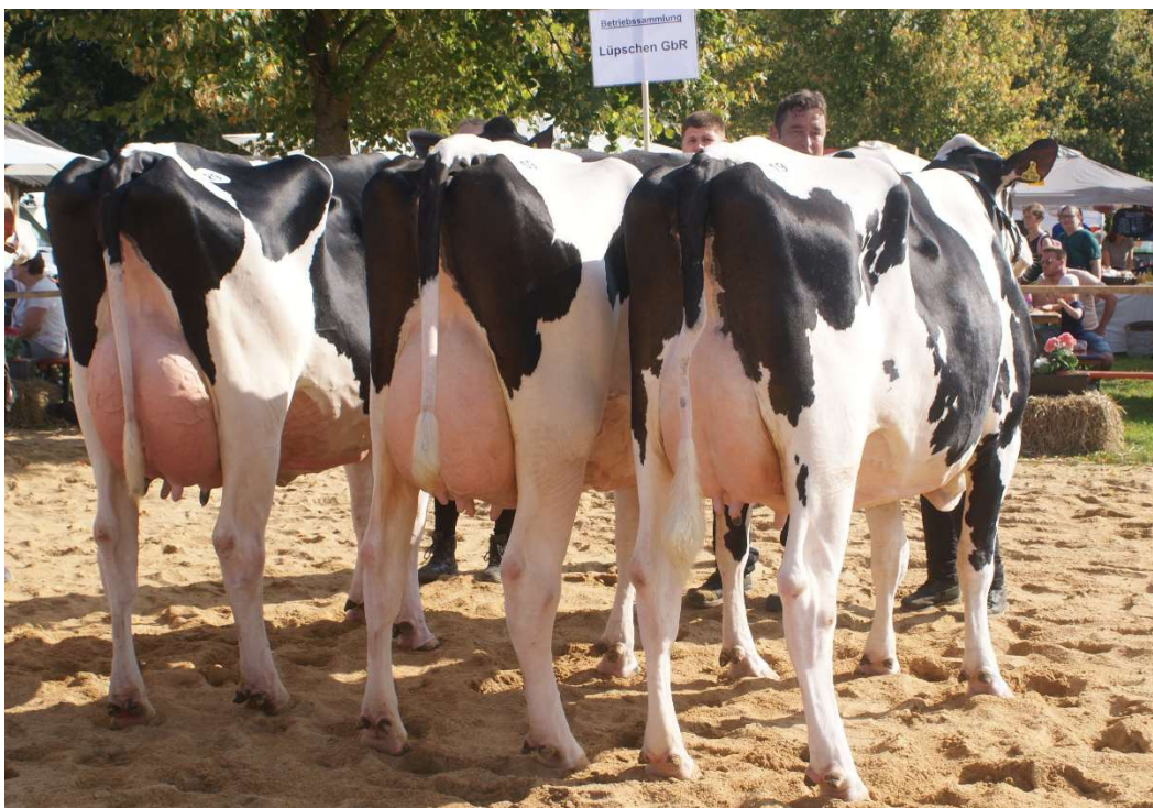
Sieger-Sammlung Lüpschen GbR