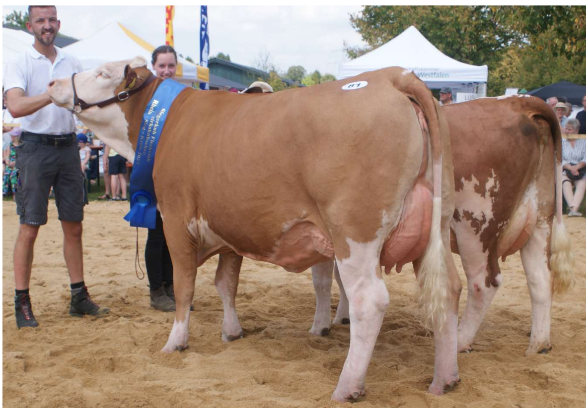
Vollkommen-Tochter KFV Web P – Kaufmann's Fleckvieh Zuchtbetrieb 1a German Dairy Show – Siegerkuh Fleckvieh Bezirksschau