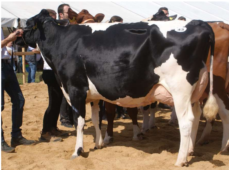
Kerryhill-Tochter Ola Milchhof Welsch GbR Reservesiegerkuh Jung Bezirksschau