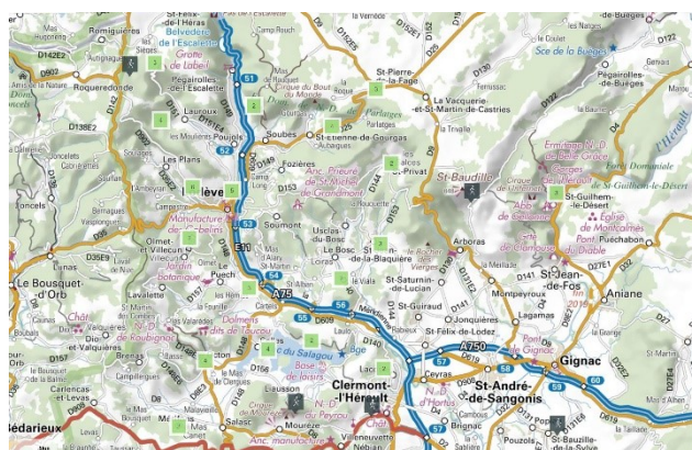
La carte des principaux circuits de marche nordique du COL

Vous allez recevoir, par voie postale votre licence du C.O.L.