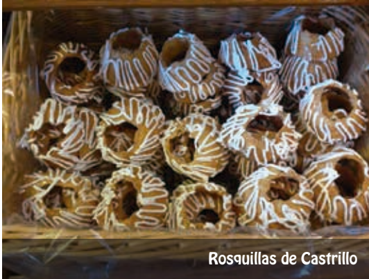
Rosquillas de Castrillo