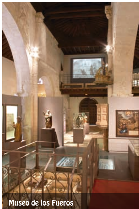
Museo de los Fueros