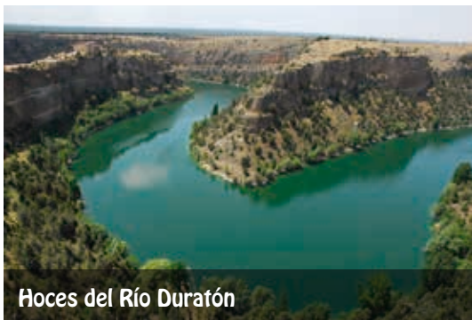
Hoces del Río Duratón

Llegando a la iglesia de Nuestra Señora la Virgen de la Peña, hay que tomar el sendero que sale junto al cuartel de la Guardia Civil en dirección a la Puerta de la Fuerza. Una vez allí, la senda continúa por la calzada romana, atraviesa el río Duratón por el puente de Picazos, llegando posteriormente al puente romano de Talcano y rodeando el casco urbano del municipio.