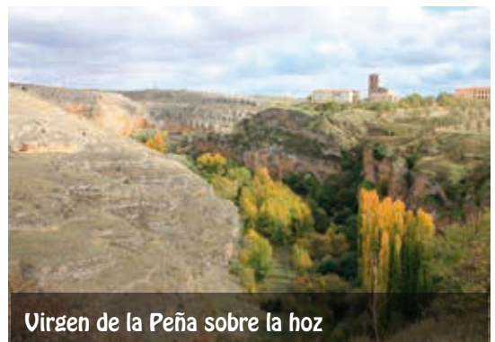
Virgen de la Peña sobre la hoz