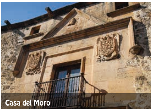
Casa del Moro

Este templo tiene una singularidad más, y es que está situado sobre una de las Hoces del Río Duratón, en un paisaje de singular belleza. Tras visitar el edificio, caminaremos hacia la parte trasera para acceder a un mirador desde donde podremos disfrutar de la vista de las primeras Hoces del Río Duratón.