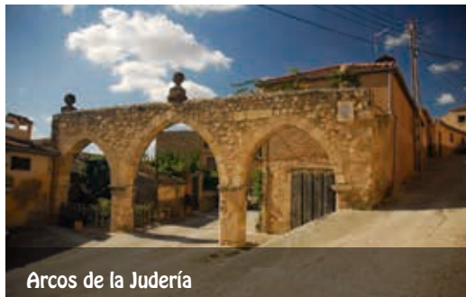
Arcos de la Judería

Su base conserva las zarpas o basamentos contruidos con sillares romanos. Además, la calle Barbacana es también importante porque por ella trascurren los tradicionales encierros que tienen lugar cada año a finales de agosto.