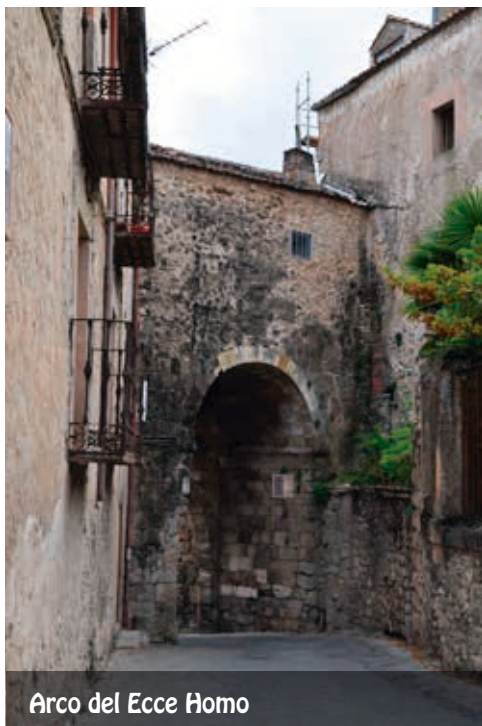
Arco del Ecce Homo

La iglesia de los Santos Justo y Pastor es un magnífico testimonio del arte románico de los siglos XII y XIII. Actualmente es la sede del Museo de los Fueros , que tiene como objetivo poner de relieve la importancia de Sepúlveda en la historia y, al mismo tiempo, la historia de Sepúlveda en el contexto de Castilla y de España.