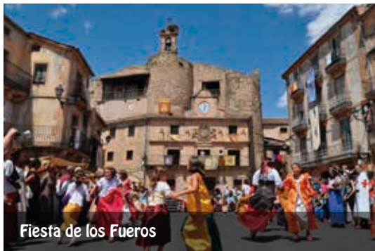
Fiesta de los Fueros

Tiene lugar cada tercer fin de semana del mes de julio. La villa de Sepúlveda revive el ambiente del mercado medieval y llena sus calles de artesanos, magia, fuego, historia, teatro y animación. De esta forma se conmemora el Fuero otorgado a la Villa por el conde Fernán González.