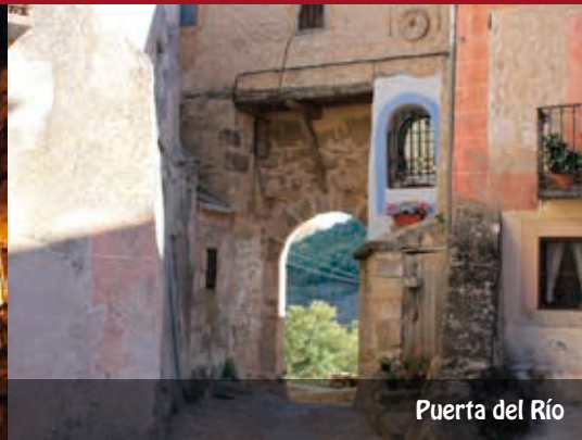
Puerta del Río

El castillo marca el límite de las murallas de la villa y es uno de los lados menores de la Plaza Mayor. Es una edificación producto de tres épocas muy distintas: en primer lugar, observamos tres torreones pertenecientes a la muralla árabe del siglo X que formaba parte, al mismo tiempo, del castillo-palacio; por otro lado, en los paños de la muralla, se abren dos balconadas pertenecientes a la casa de los González de Sepúlveda, edificio del siglo XVI, y cuyos muros vieron nacer al conocido escritor Don Francisco de Cossío; en el siglo XVIII, al castillo se le adosó una fachada barroca acompañada de una espadaña situada en el torreón central y formada por dos campanas.