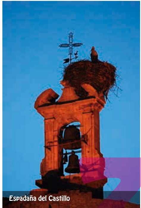
Espadaña del Castillo

Seguimos por la Calle del Conde , una de las más pintorescas de la localidad, donde destaca la balconada de la Casa del Conde . Unos metros después nos topamos con un ábside de ladrillo de gran belleza, el único de este tenor en la villa, el perteneciente a la iglesia de Santiago , otra de las cinco