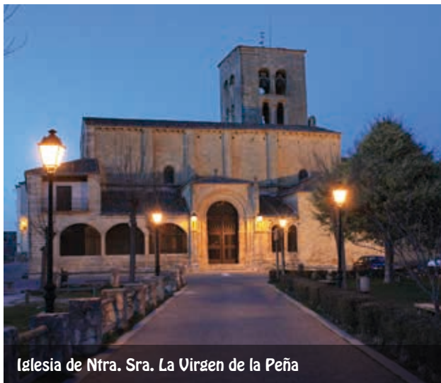
Iglesia de Ntra. Sra. La Virgen de la Peña

La planta de esta construcción románica, del s. XII, es idéntica a la de la iglesia de El Salvador, aunque el pórtico actual es casi todo del s. XVI. Tiene nave alta, ábside al saliente y torre adosada. La característica más significativa del templo es el tímpano situado en la puerta de entrada, único en Segovia y en el románico segoviano. El ábside es casi idéntico al de El Salvador, con columnas adosadas, arcos abocelados en sus vanos y una moldura ajedrezada que recorre todo el hemiciclo. La bóveda es de sillar de medio cañón, con arcos ciegos a uno y otro lado, sobre los que corre la cornisa que sirve de apoyo a la bóveda, sustentada por impostas columnares de triple fuste. En esta iglesia se encuentra la imagen de la patrona de la Villa y su Tierra, Ntra. Sra. de la Peña, talla en madera policromada del s. XII, que representa a la Virgen sentada con el Niño en brazos. Una artística verja de hierro separa el altar mayor de la nave.