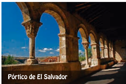
Pórtico de El Salvador