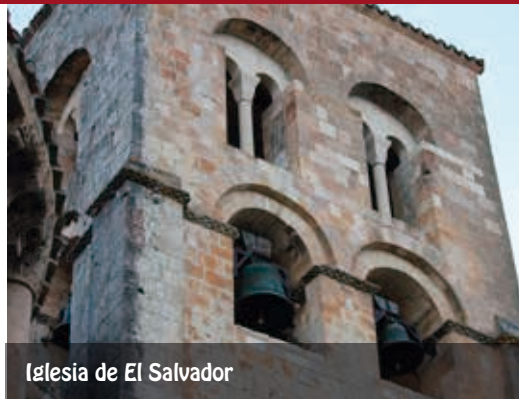
Iglesia de El Salvador

Iglesia de El Salvador. Declarada Bien de Interés Cultural, es considerada el edificio románico más antiguo (s. XI - año 1093), de la provincia de Segovia y al sur del Duero y constituye uno de los paradigmas del románico castellano. Tiene una sola nave de ábside semicircular y la torre se encuentra separada de la misma y se comunica con ella a través de un estrecho pasadizo abovedado. La nave, cubierta con bóveda de cañón, está dividida en tres tramos por arcos fajones apeados en pilastras. Adosadas a los muros tiene arcadas ciegas sobre columnas y un hermoso pórtico, con arcos agrupados por parejas, apoyándose cada uno separadamente en anchas pilastras y, al juntarse, en columnas comunes.