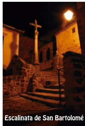
Escalinata de San Bartolomé