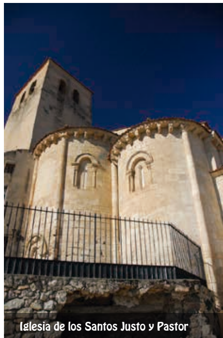
Iglesia de los Santos Justo y Pastor

Actualmente alberga el Museo de los Fueros , en el que se ha dispuesto un recorrido temático que tiene los siguientes capítulos: la historia de Sepúlveda, Patronazgo y Mecenazgo, los Fueros en la Edad Media, los hombres del Fuero y la Comunidad de Villa y Tierra de Sepúlveda. En las tres naves del templo, su coro alto y su singular cripta, se exponen esculturas, pinturas, documentos históricos y restos arqueológicos, todos ellos originales, relacionados con cada uno de los citados aspectos, abarcando una cronología comprendida entre el s. XIII y el s. XVIII. Una serie de audiovisuales y paneles ilustrados ayudan al visitante a conocer los aspectos básicos de cada uno de los temas tratados.