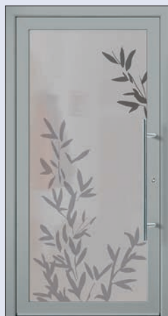
VIGRO 19 U d -Wert 1,20 *) Farbe Weissaluminium Info Motiv Mindestmaß= 700 x 1.900 mm