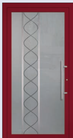
VIGRO 31 U d -Wert 1,20 *) Farbe Weinrot Extras Alunox Mindestmaß= 700 x 1.900 mm