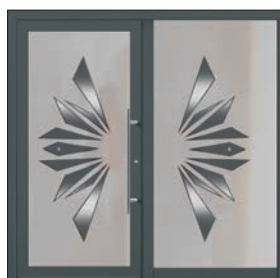
Breites Seitenteil: Maße bis 1000 x 2240 mm U d -Wert 0,90

Ab einer Gesamtgröße von 2.150 x 2.240 mm bzw. 1.750 mm x 2.750 mm wird die Verglasung lose in einem Holzverschlag geliefert – Aufpreis 98,- € inkl. MwSt.