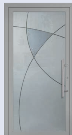
VIGRO 35 U d -Wert 1,20 *) Farbe Weissaluminium Extras 6 Swarovskisteine Mindestmaß= 700 x 1.900 mm