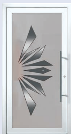
VIGRO 17 U d -Wert 1,20 *) Farbe Verkehrsweiss Extras Alunox, 1 Swarovskistein Mindestmaß= 700 x 1.900 mm