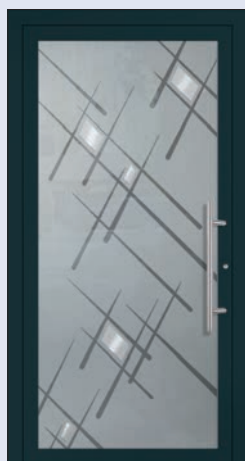
VIGRO 33 U d -Wert 1,20 *) Farbe Anthrazitgrau Extras Alunox Mindestmaß= 700 x 1.900 mm