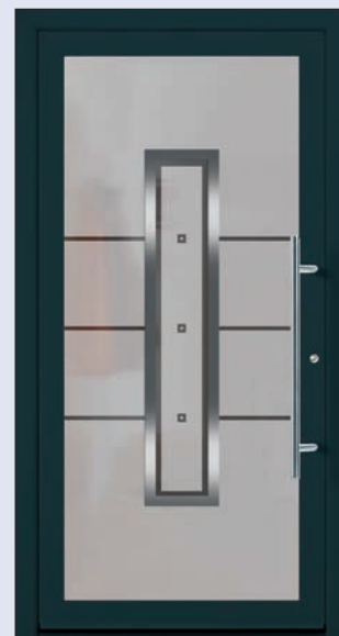
VIGRO 02 U d -Wert 1,20 1) Farbe Anthrazitgrau Extras Alunox Mindestmaß= 700 x 1.900 mm