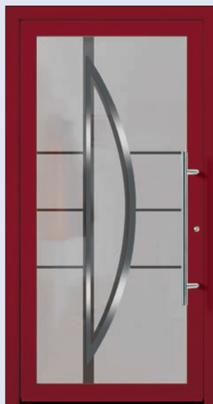
VIGRO 03 U d -Wert 1,20 1) Farbe Weinrot Extras Alunox Mindestmaß= 700 x 1.900 mm