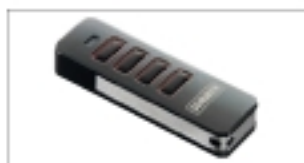
Pearl 4-Befehl Handsender