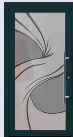
VIGRO 21 U d -Wert 1,20 *) Farbe Anthrazitgrau Mindestmaß= 700 x 1.900 mm