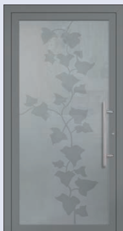
VIGRO 32 U d -Wert 1,20 *) Farbe Graualuminium Mindestmaß= 700 x 1.900 mm