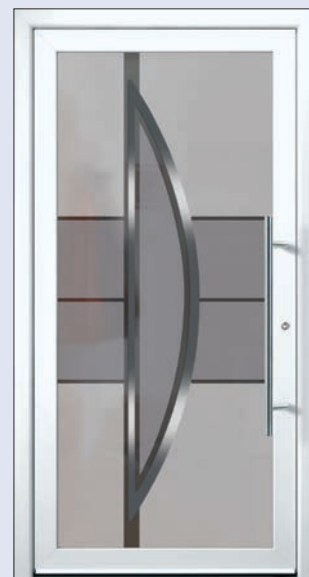
VIGRO 04 U d -Wert 1,20 1) Farbe Verkehrsweiss Extras Alunox Mindestmaß= 700 x 1.900 mm