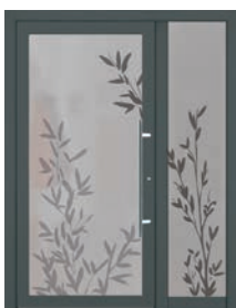
Schmales Seitenteil: Maße bis 600 x 2240 mm U d -Wert 1,00

3-fach Verglasung P4A / WSG Klarglas außen / Motivglas mittig, alternativ vollflächig sandgestrahlt / Sicherheitsglas VSG 6 mm innen. Bei Seitenteilen mit Motivverglasung, keine Änderung der Motiveinteilung möglich.