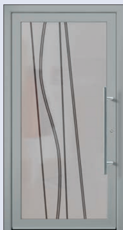
VIGRO 14 U d -Wert 1,20 *) Farbe Weissaluminium Mindestmaß= 700 x 1.900 mm