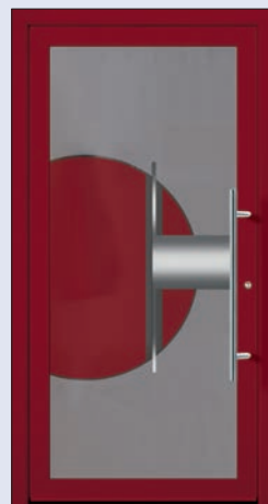
VIGRO 20 U d -Wert 1,20 *) Farbe Weinrot Extras Alunox, lackiert Mindestmaß= 700 x 1.900 mm