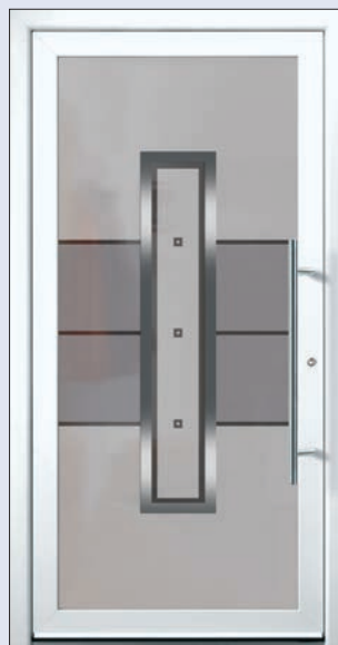
VIGRO 01 U d -Wert 1,20 1) Farbe Verkehrsweiss Extras Alunox Mindestmaß= 700 x 1.900 mm