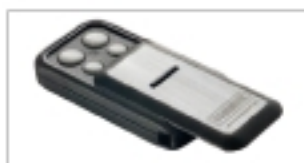
Slider 4-Befehl Handsender