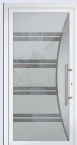
VIGRO 34 U d -Wert 1,20 *) Farbe Verkehrsweiss Mindestmaß= 700 x 1.900 mm