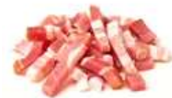
50 gr de lardons fumés