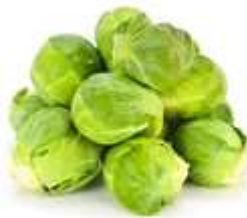
500 gr de choux de Bruxelles