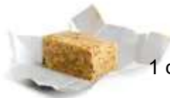
1 cube de bouillon