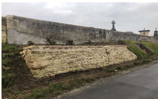
Rénovation et fleurissement d'un mur de soutènement en face du lotissement La Muscadelle.

Un nouveau parterre vient d'être créé devant la salle des fêtes. Il accueillera le logo de la commune en végétaux.