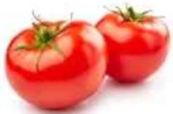
500 gr de tomates fraîches ou en boîte