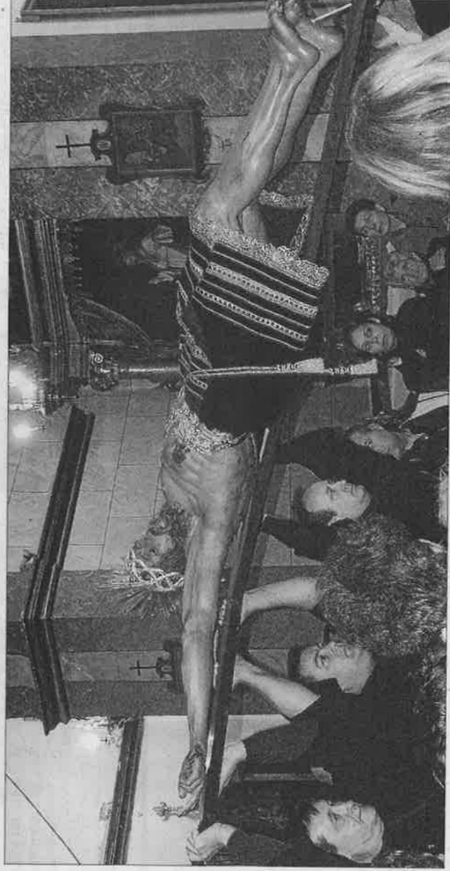
El Novenario comienza con la entrada del Santísimo Cristo del Cementerio en la iglesia del Convent de Dalt Vila.

Según cuenta Cardona, a las misas acudían personas de todos los pueblos de Eivissa y muchas eran las mujeres que, en los años 50 o 60 del siglo pasado, querían formar parte del coro que cantara durante las homilias. «La devoción a esta imagen, que recibe su nombre porque detrás de la iglesia había un cementerio, siempre ha sido una de las más extendidas en las Pitiusas, después de Santa María de las Nieves, incluso entre muchos marineros que según llegaban a Vila y veían la imagen hacían sonar las si-