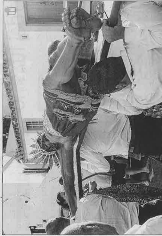
La procesión mantuvo un paso solemne a lo largo del recorrido, que se completó en unos 40 minutos.

Así, sobre las 19.15 horas, siete cofrades auparon la imagen del Santísimo Cristo y la sacaron a hombros de la iglesia de Santo Domingo con la máxima solemnidad. Les precedía el portador del estandarte de la cofradía y la banda de tambores y cornetas, formada por unos 15 músicos, y tras todos ellos, siguieron el paso siete cofrades mujeres, los representantes de la Diócesis de Eivissa y Formentera, encabezados por el obispo