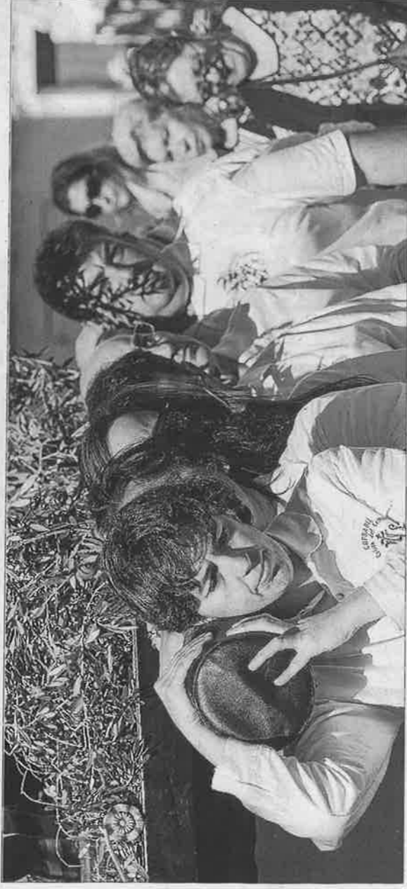
En la cara de los cofrades del Cristo del Cementerio se comprueba el esfuerzo realizado mientras suben hacia Santo Domingo.