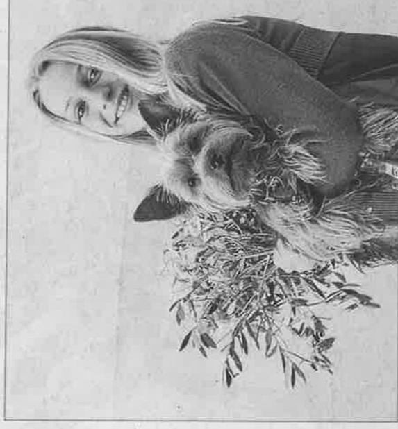
En la procesión hubo sitio hasta para ir con la mascota.