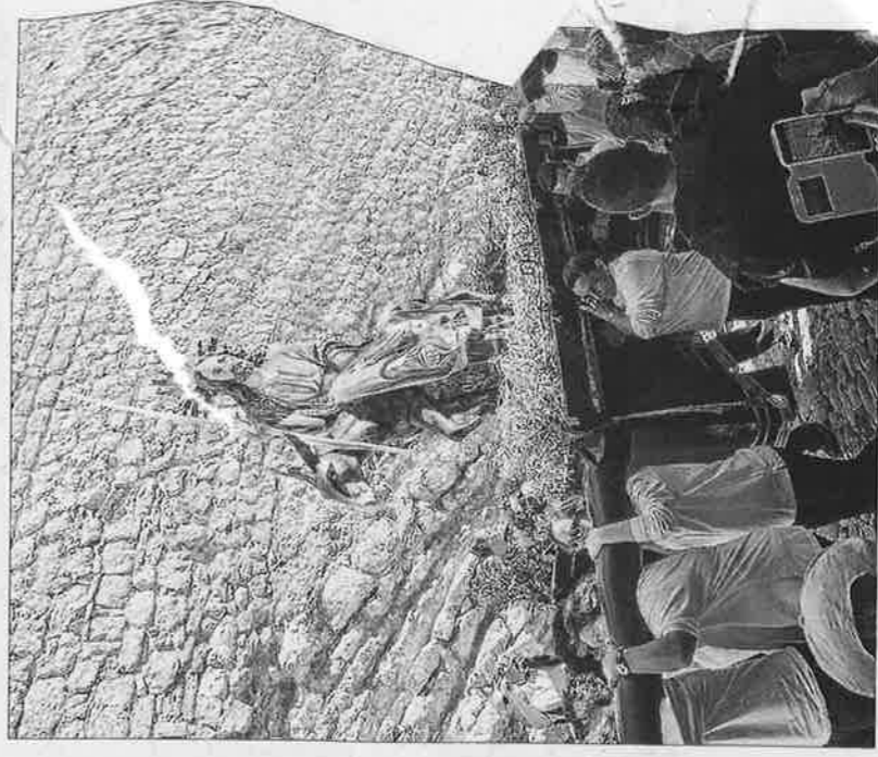
La radiante mañana de ayer invitó a disfrutar de la procesión.

medida que el público fue arremolinándose en torno al paso que portaban los hermanos de la Cofradía del Cristo del Cementerio.