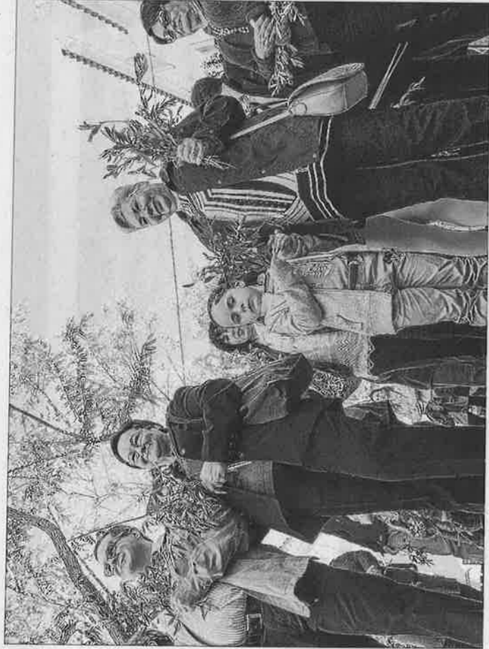
Niños y mayores acompañaron a La Borriquita en su traslado.