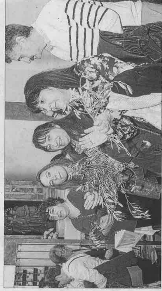
Palmas y ramos de olivo. Como no podía ser de otra forma, las palmas y los ramos de olivo inundaron con su presencia las calles de Dalt Vila.

El traslado de La Borriquita hasta Santo Domingo congregó en la procesión a fieles de todas las edades