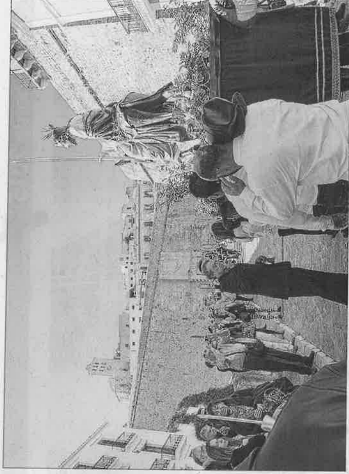
La subida del paso hacia Dalt Vila fue realizada por una cuadrilla de hombres y mujeres.