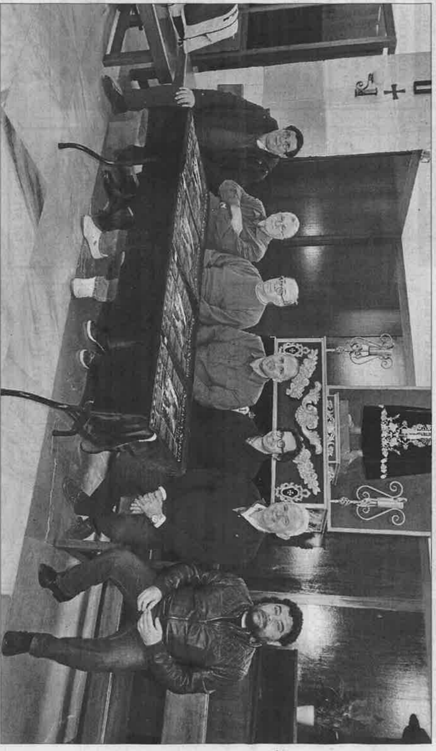
Los representantes de las siete cofradías de Eivissa, ayer en la presentación del cartel de los actos de Semana Santa. VICENT MARI

La ilusión y el trabajo de las siete cofradías eclosionarán el Viernes Santo, el 30 de marzo, en la procesión del Santo Entierro, en la que está previsto que participen más de 1.500 personas. En cuanto al recorrido, los cofrades explicaron que lo confirmarán el 8 de marzo, día que se reunirán con el obispo de la Diócesis de Eivissa. No obstante, creen que será el habitual tras haber concluido las obras del paseo de Vara de Rey. Por otro lado, explicaron que intentarán que sea una procesión fluida, aunque pun-