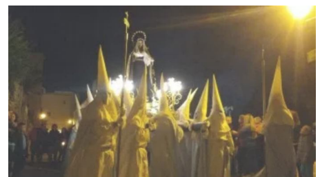
El espíritu de la Semana Santa recorre las calles de Vila y Santa Eulària