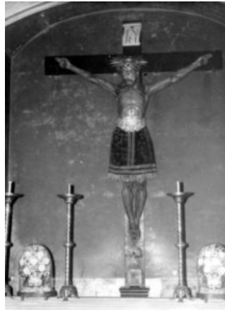
Cristo del cementerio, en la década de los años 60 del siglo pasado.

Este Cristo no era igual a los demás que había visto. Este era de tamaño de un hombre real y con un cuerpo bien formado. Vestido con faldilla bordada, lucía a sus pies una pequeña cajita con un clavo y un sello de lacre en una cinta roja que lo certificaba como clavo perteneciente a la antigua y muy venerada imagen por los ibicencos devotos y necesitados de su ayuda, que fue destruida durante las primeras semanas de la guerra civil. La nueva imagen recogía las oraciones y devociones de los antiguos feligreses y los nuevos que asistían a rezarle, especialmente durante el novenario que se celebraba cada año desde 1848.