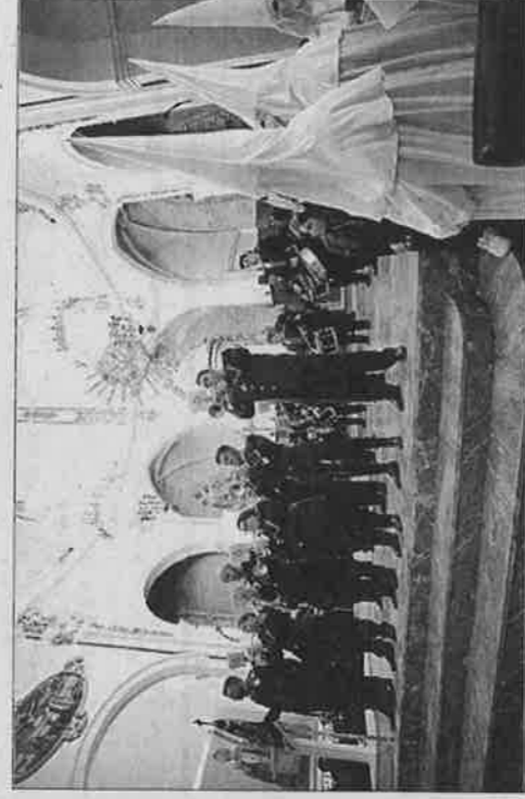
La banda de la cofradía Nuestro Padre Jesús del Gran Poder. J.A. RIERA

gregación nunca había fallado a esta cita. «Hallovznado otras veces y se ha hecho igualmente la procesión. Sólo una vez, en 2009, nos quedamos a medio camino porque y el viento, que azotaba fuerte en la