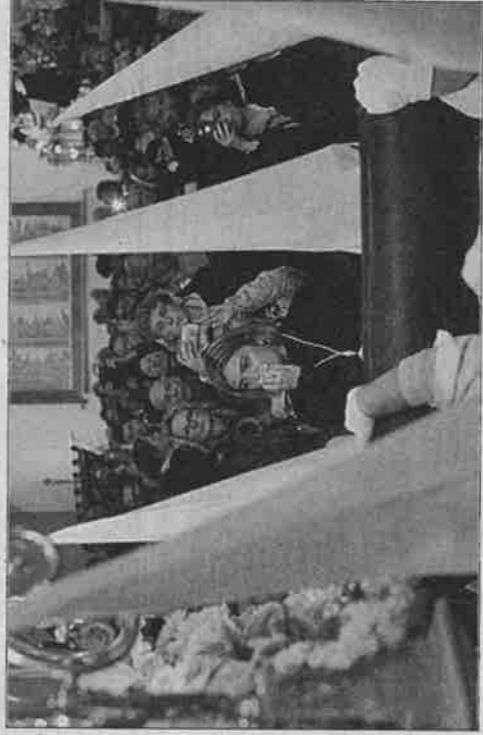
Una mujer emocionada, ante la imagen de la Dolorosa. VICENT MARI