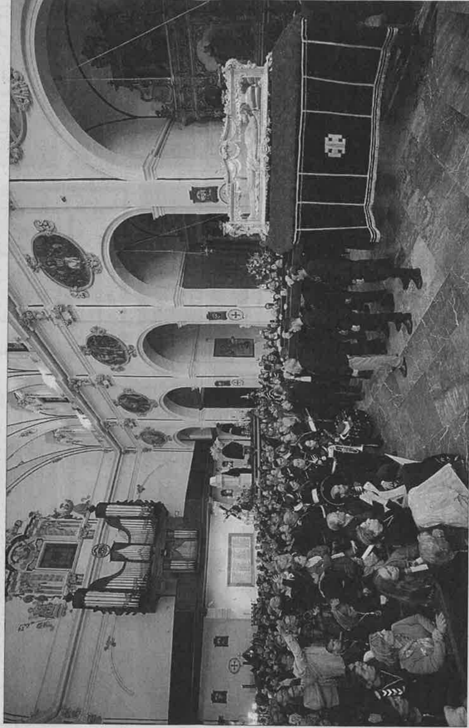
Un momento del oficio religioso en la catedral con la imagen del Cristo Yacente en primer término y la del paso del Misterio, de fondo.