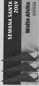
SEMANA SANTA 2019

► El obispado y las siete cofradías acuerdan suspender su salida y organizan un acto religioso en el interior de la catedral