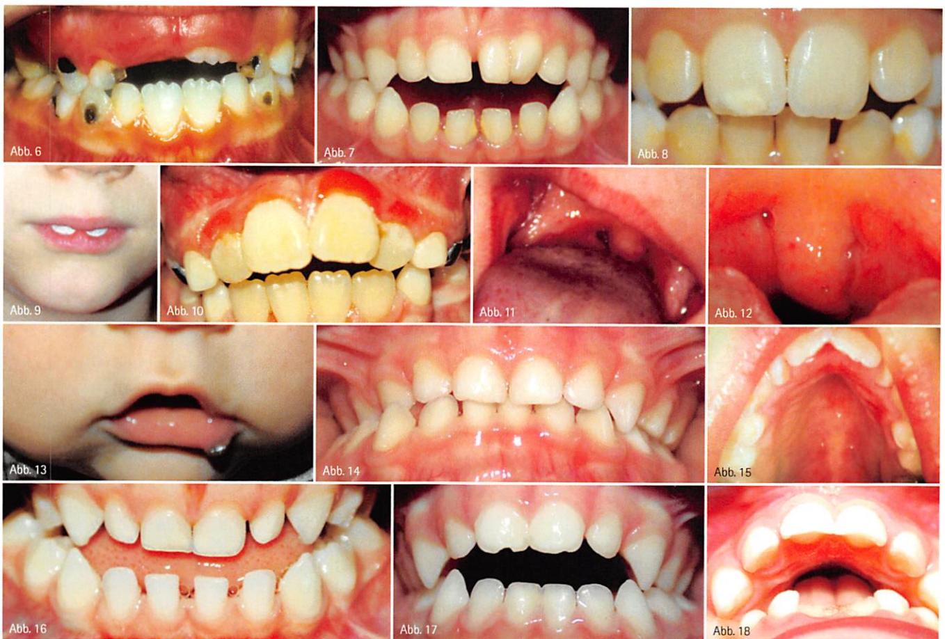
Abb. 6: Karies im Wechselgebiss in den Milchzähnen. Selbstverständlich sollten diese Zähne behandelt werden. – Abb. 7: Zahnstein im Milchgebiss. – Abb. 8: Entmineralisierungen, Verfärbungen an den Zähnen. – Abb. 9: Weiße Verfärbungen an den Zähnen, verursacht durch das Austrocknen des Zahnschmelzes. – Abb. 10: Gingivitis. – Abb. 11: Geröteter Rachenring. – Abb. 12: Stark vergrößerte Tonsillen. – Abb. 13: Unwillkürlicher Speichelverlust bei sechs Monate altem Baby. – Abb. 14: Kreuzbiss rechts im Milchgebiss. – Abb. 15: Hoher gotischer Gaumen im Wechselgebiss. – Abb. 16: Unterkiefer größer als Oberkiefer (Speichelbläschen zwischen den Zähnen sind charakteristisch für ein unphysiologisches Schluckmuster) im Milchgebiss. – Abb. 17: Frontal offener Biss im Milchgebiss. – Abb. 18: Vergrößerte sagittale Stufe (Speichelbläschen im Mundvorhof) im Wechselgebiss.

Wenn Habits entwöhnt werden, schließt sich der Biss oft teilweise von selbst. Was aber ist mit der gestörten orofazialen Muskulatur? Diese hat die Aufgabe, das Gebiss in Form zu halten bzw. erst einmal in Form zu bringen.