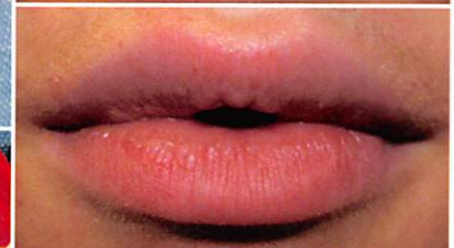
Abb. 1: Vierjähriges Mädchen, bei der sich das Saug-Schluck-Muster noch nicht in ein Kau-Schluck-Muster entwickelt hat. – Abb. 2 und 3: Habitentwöhnung: Schnullerentwöhnung, Myofunktionelle Therapie. Ein Loch im Gummiteil sorgt für Veränderung beim Saugen (Furtenbach et al. 2013). – Abb. 4: Die Lippen sind luftdicht abgeschlossen. – Abb. 5: Im seitlichen Lippenbereich kann man sehr gut den „Klebeefferkt“ der Lippen erkennen.