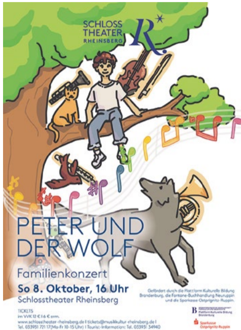
© Peter und der Wolf Plakat