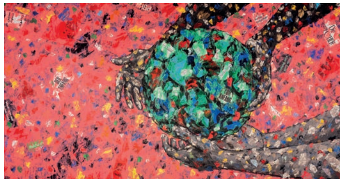
Das Misereor-Hungertuch 2023/2024 „Was ist uns heilig?“ von Emeka Udemba

Am Dienstag, den 27. Februar 2024 wird die Abendmesse in Neuenkirchen um 19.00 Uhr inhaltlich gestaltet mit Impulsen zum Hungertuch.