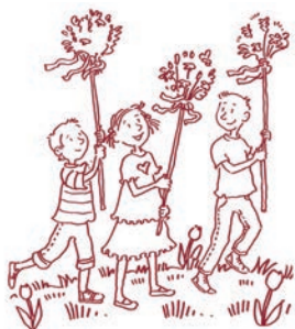
Bild: Ursula Harper St. Benno-Verlag, Leipzig | In: Pfarrbriefservice.de