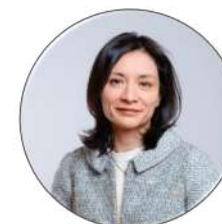
Marraine de l'édition 2021 Delphine Gény-Stephann

Ancienne Secrétaire d'État auprès du Ministre de l'Économie et des Finances