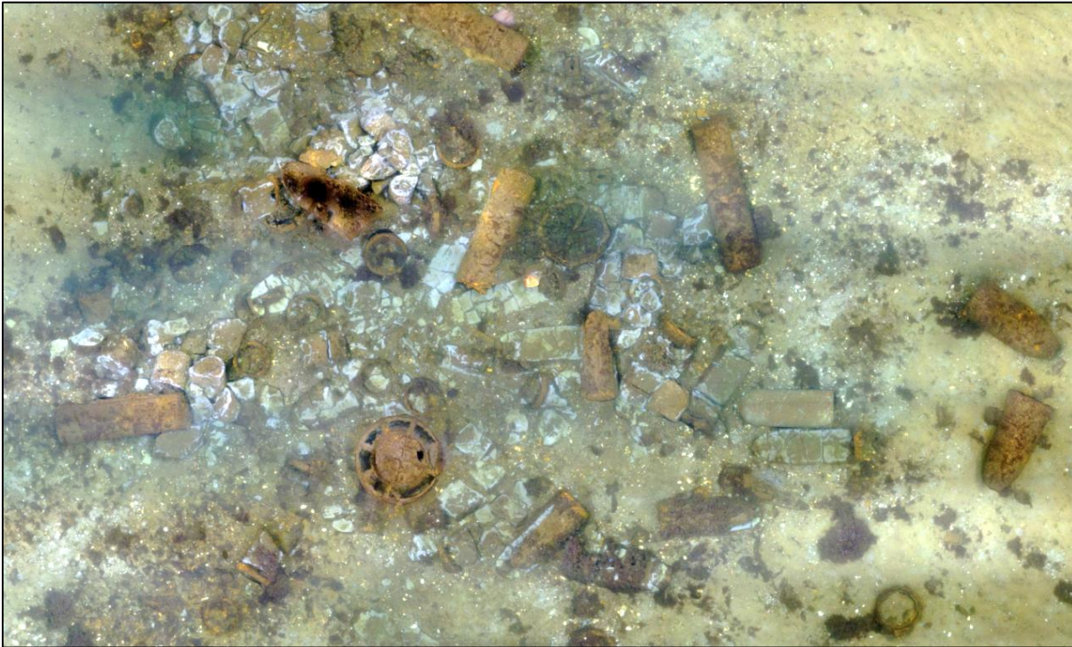
Photomosaik eines Munitionshaufens im Versenkungsgebiet in der Kolberger Heide