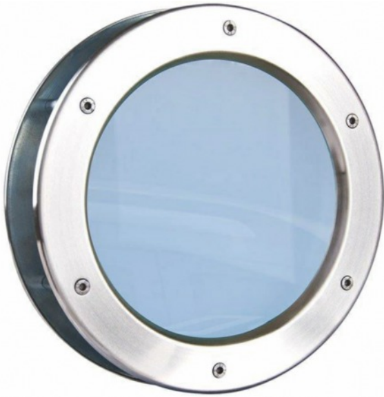
Bullauge Seite mit Verschraubung