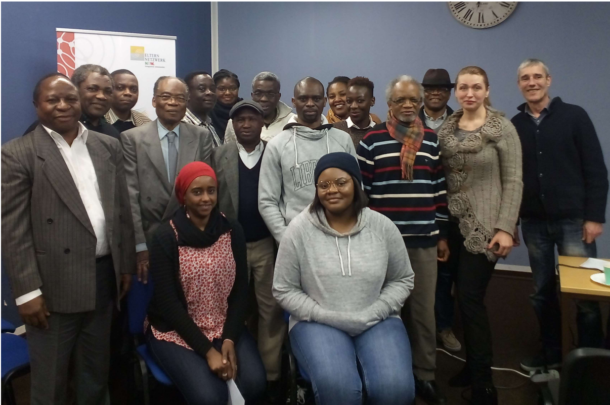
19 Vertreter*innen der afrikanischen Diaspora aus 13 Vereinen nahmen am Modul 4 in Köln teil