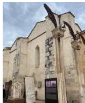
Chapelle Notre Dame des Anges

L'itinéraire « Chemin Catalan », établi comme Chemin vers Saint-Jacques, vient de Montpellier, Béziers et Narbonne. Il rejoint l'Espagne au col de Panissars et se poursuit en Catalogne.