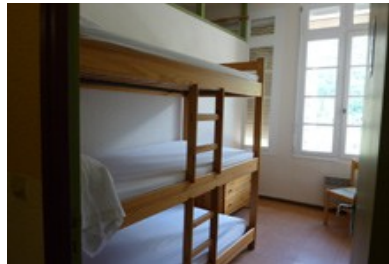
Gîte de groupe : 4 logettes de 3 lits