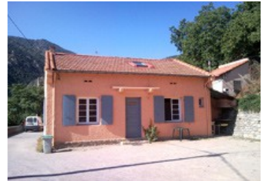
Gîte d'étape lits en dortoir