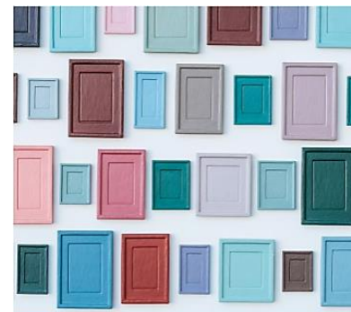
Entwicklung eines mediendidaktischen Konzepts