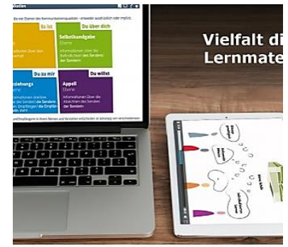
Vielfalt digitaler Lernmaterialien