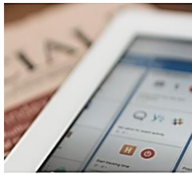
Lehr-Lernprozesse mit digitalen Medien gestalten