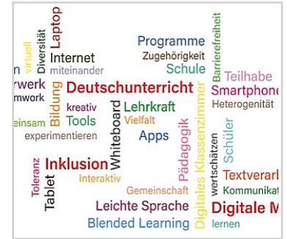
Digitale Medien und Inklusion im Deutschunterricht