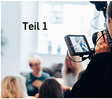
Videos kommentieren und diskutieren Teil 1: Einstieg