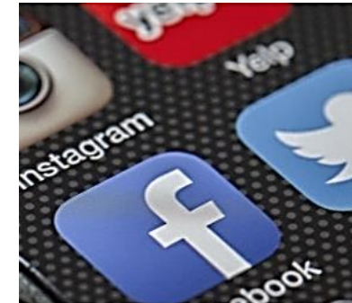
Mobile Learning in der Schule