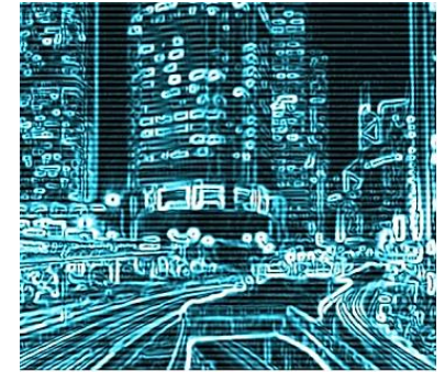
Leben und Lernen in digital geprägten Gesellschaften