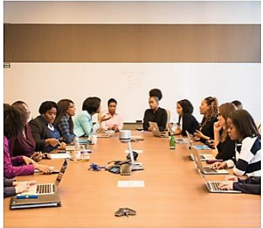
Online-Kurs Veränderungen in der Schule bewirken