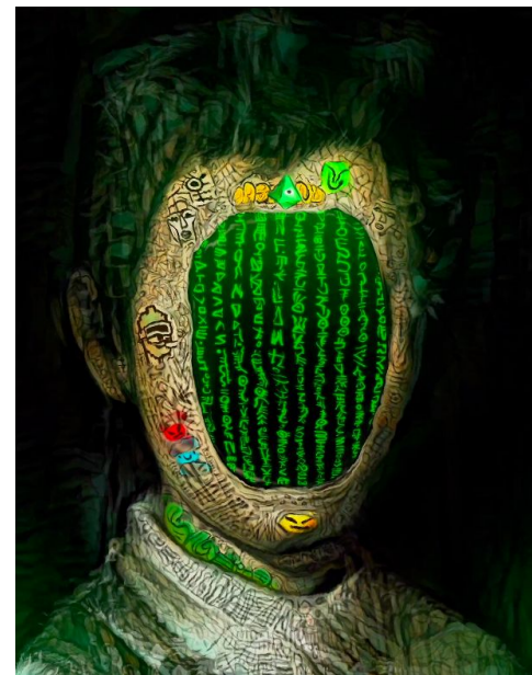
CryptoVandalized AI Portrait #005: Tox ©Flan iLevick. 2021

* ENTRADA LIBRE Y GRATUITA (hasta completar aforo). Más información en: www.digitaljove.com