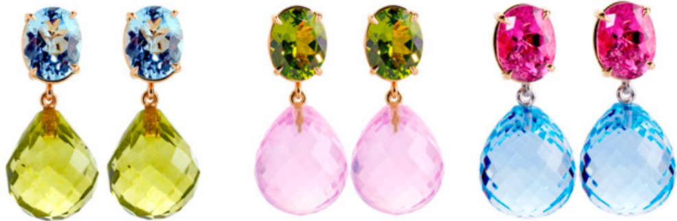
FRECHE FARBPAARE IN PASTELL FÜR'S OHR. ÜBERRASCHENDER MIX AUS DER Collection Surprise : TOPAS, GRÜNE BERNSTEINE, PERIDOT, ROSENQUARZ UND TURMALIN.