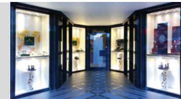
Freisfeld in Mönchengladbach

Im Mai 2018. Die Abbildungen des Schmucks sind zum Teil vergrößert. Unsere Schmuckmodelle sind geschützt.