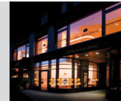
Brahmefeld & Gutruf in Hamburg