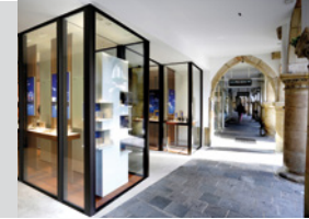
Freisfeld in Münster