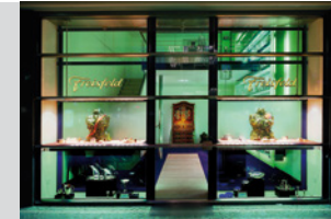
Freisfeld Mitte in Münster