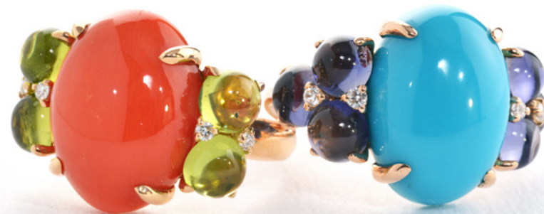
FARBOMBEN: RINGE MIT Koralle UND Türkis EXPLODIEREN IN IHRER FARBKRAFT.