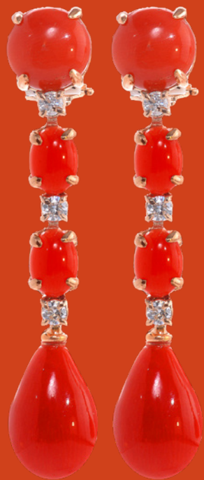
Korall KNALL: INTENSIVE LEUCHT- KRAFT IN SIGNALFARBEN.