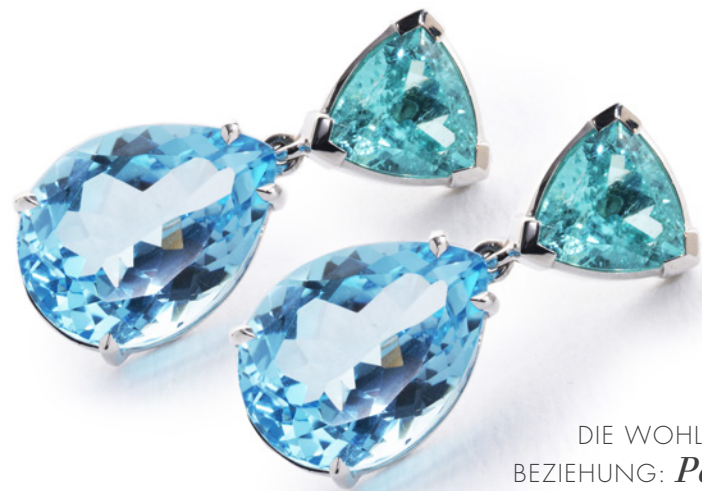
DIE WOHL SCHÖNSTE DREIECKS- BEZIEHUNG: Paraiba -TURMALINE IM TRIANGEL-SCHLIFF.