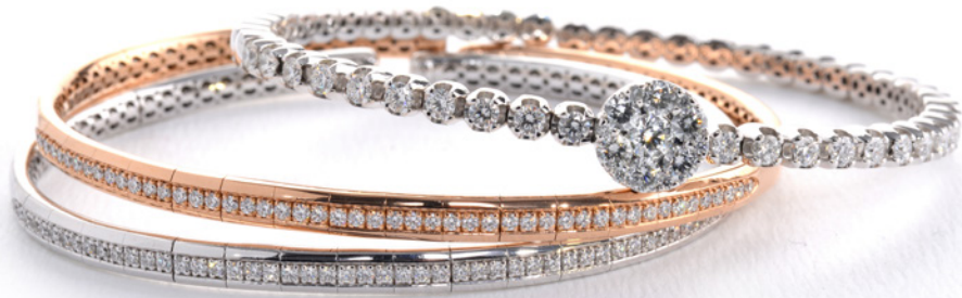
ARMLEUCHTER: FEINE Brillanten FUNKELN AM HANDGELENK UM DIE WETTE.