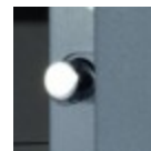
Pêne diamètre 20 mm