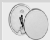
Serrure à clefs double Panneton Mauer