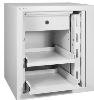
CWP AVEC PORTE RENTRANTE DANS LE COFFRE FORT NOMBREUX ACCESSOIRES POUR BIJOUTERIES